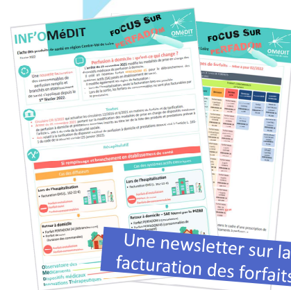
Une newsletter sur la facturation des forfaits