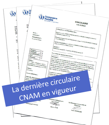
La dernière circulaire CNAM en vigueur