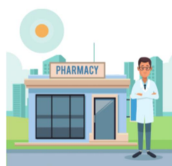
Dispensation par l'officine de ville