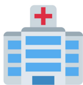
Prescription par un professionnel de santé au sein d'un établissement de santé